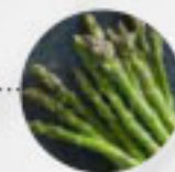
SPARGEL grün (Deutschland, Italien, Spanien)