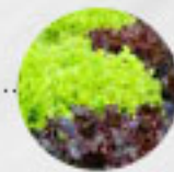
LOLLO ROSSO/ LOLLO BIONDA (Deutschland)