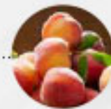
PFIRSICHE (Italien, Spanien, Griechenland)