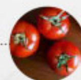
TOMATEN (Deutschland, Niederlande, Belgien)