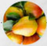
BIRNEN Dr. Guyot (Frankreich)