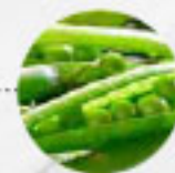
SCHOTEN/ ERBSEN (Deutschland)