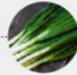
FRÜHLINGS- ZWIEBELN (Deutschland)