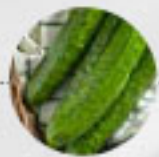
GURKEN (Deutschland, Niederlande, Belgien)