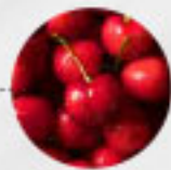
KIRSCHEN süß (Deutschland, Griechenland, Türkei)