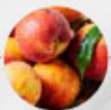
NEKTARINEN (Italien, Spanien, Griechenland)