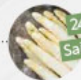
SPARGEL weiß (Deutschland)