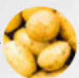
SPEISEFRÜH- KARTOFFELN (Deutschland)